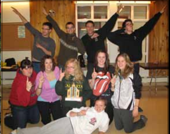
"Down and dirty" : Grand Nettoyage des Rivages Canadiens