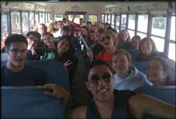
Ye-ye-ye-ye : Camp Fall N. 101